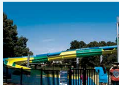
Nowra Aquatic Centre, NSW