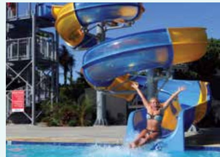
Nobby Beach Holiday Village, QLD