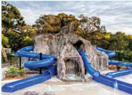
Big 4 Tweed Billabong Holiday Park, NSW