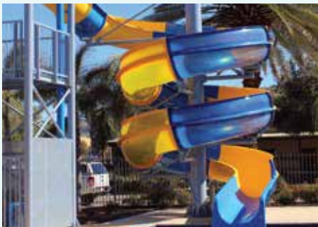
Big 4 MacDonnell Range Holiday Park, NT