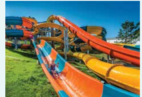
The Big Banana Fun Park, NSW