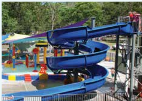
Big 4 Cania Gorge Caravan Tourist Park, QLD