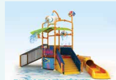
Z03 ПОДВОДНЫЙ МИР