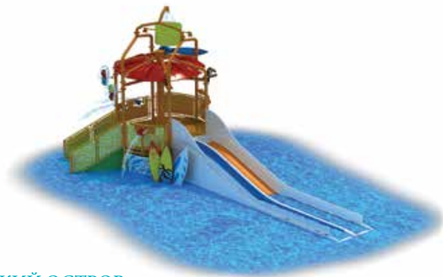
A01 РАЙСКИЙ ОСТРОВ