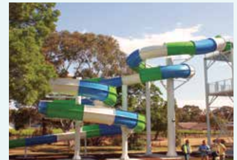
Marion Swimming Centre, SA