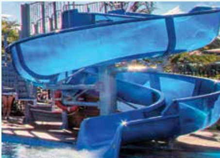
Big 4 Gold Coast Holiday Park, QLD

*Все водные горки производства Polin Waterparks.