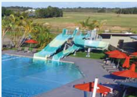
Big 4 Rivershore Resort, QLD