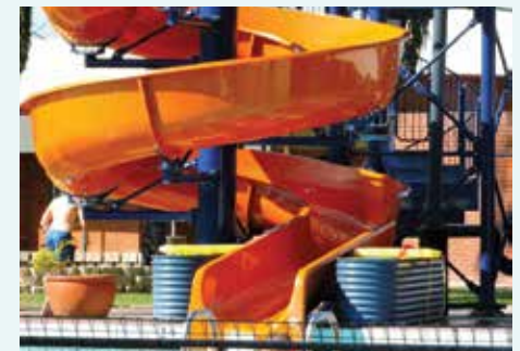
Casino Olympic Pool & Gymnasium, NSW