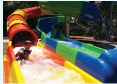
Big 4 Nambucca, NSW