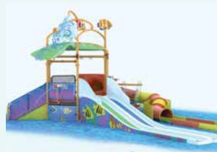
A02 ПОДВОДНЫЙ МИР