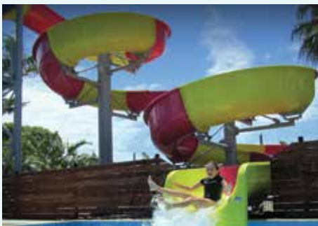
Big 4 Capricorn Palms Holiday Village, QLD